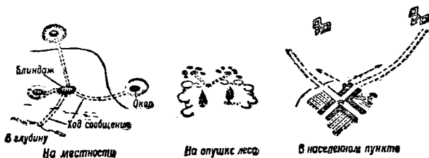
Рис. 1. Оборудование огневых позиций противотанковых (ПТ) ружей

Примерное оборудование огневых позиций см. на рис. 1.